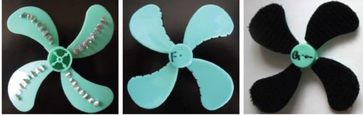
写真左から E：ポルテックジェネレーター F：切り込み G：ベルクロ ※Gのみa(表)/b(裏)/c(両面)を加工