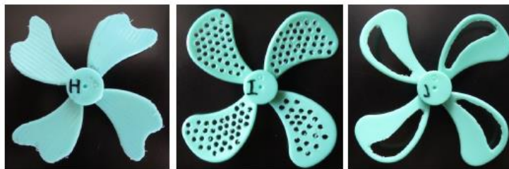
H：蝶の鱗粉型 I：ディンプル穴 J： \frac{1}{2} 穴